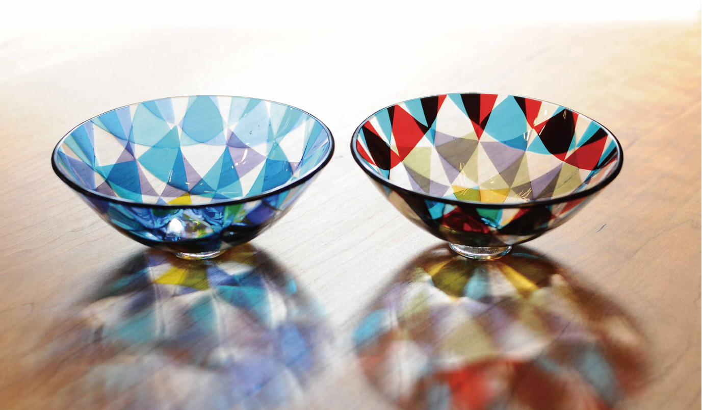
Kaleido tea bowl / カレイド平茶碗